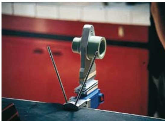
Foto 1: Apparecchiatura per la giunzione manuale di tubi e raccordi da saldare nel bicchiere

Im nachfolgend dargestellten Verfahren wird das Heizelementmuffenschweißen von Hand dargestellt. Das Bild (PHOTO 1) zeigt einen Heizspiegel mit einem Heizdorn und einer Heizbuchse. Dieses Verfahren wird bei Dimensionen bis 63mm angewandt. Bei größeren Dimensionen werden Heizelementstumpfschweißmaschinen (automatische Schweißmaschinen) eingesetzt, die jedoch spezifische Kenntnisse der Maschinen erfordern. Es empfiehlt sich daher, die Hinweise der Maschinenhersteller genau zu beachten.